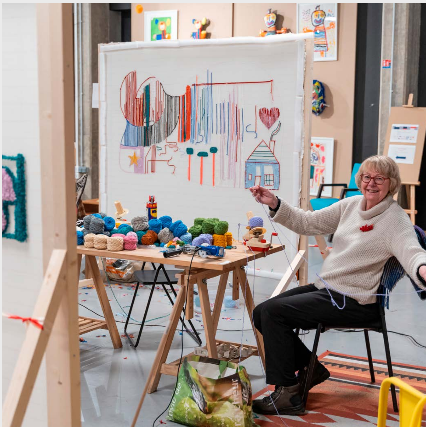
Patchwork, événement dans le cadre du projet Faire-Connaissance, 11 décembre 2024